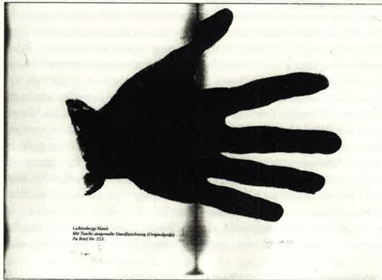
Abbildung 1: »Lichtenbergs Hand«

Literaturwissenschaft will und kann nicht nur verzeichnen und analysieren, was es alles gibt auf dem Felde der literarischen Produktion, sie muss auch interpretieren und werten, um das Belanglose auszuschneiden aus ihren großen Erzählungen. Wo immer aber das mediale Umfeld eines Textes mit in den Blick gerät, ist auch die Gefahr gegeben, dass Unbedeutendes auftaucht. Gerade auch in Briefen – wieviel Unbedeutendes können sie doch verzeichnen! Wie aber damit umgehen? Den Sinn und die Stilblüten ins Töpfchen der Literaturwissenschaft und die Makulatur ins Kröpfchen der Medienwissenschaft? Der Annahme folgend, dass Briefe ein Prozess des Literarischen sind und den Begriff des Medialen deshalb spezifizieren als Korrespondenz zwischen Literatur- und Medienwissenschaft, kann man nicht postulieren, dass der Sinn immer immateriell, virtuell oder medial sei und die Makulatur sich in der Materialität des Medialen wieder findet. Auch hierzu ein Beispiel: